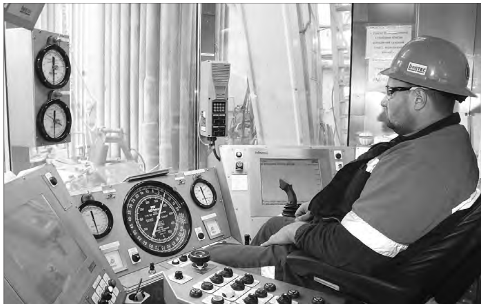
Технічне «серце» сучасної бурової установки, яку використовують працівники «Укргазвидобування», нагадує науково-дослідницьку лабораторію.

Щоправда, не такі «гарячі» голови акцентували увагу на іншому. Так, зауважували вони, планку двадцятимільярдного газовидобутку форсованими темпами за такий короткий проміжок часу подолати не вдалося. Не тільки із суб'єктивних, а й з об'єктивних причин. Коли стало зрозуміло, що «шкурка» такого форсування не варта вичинки з огляду на цінову та іншу політику на досить мінливому ринку вуглеводнів. Але чи справді цілковито змарновані час, кошти й ресурси, витрачені на виконання програми 20/20? Зовсім ні! Бо саме вона остаточно розірвала пуповину, яка найміцніше прив'язувала вітчизняну галузь до, м'яко кажучи, застарілих «радянських» технологій і стандартів.