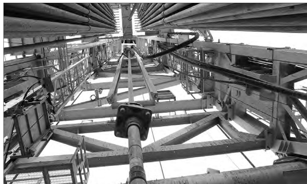
Щоб дістати вуглеводневі скарби, сьогодні доводиться занурюватися під землю дедалі глибше.

дають майбутню Україну як експортера (!) газу, «павербанку Європи» й енергетичного хабу континенту.