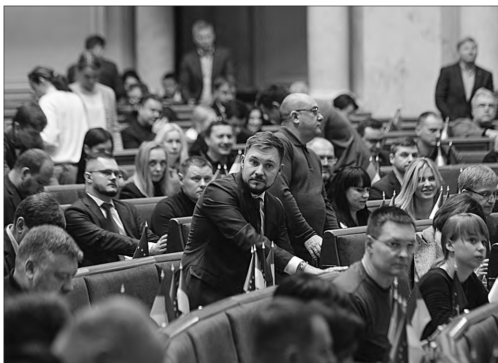
Під час засідання.

Крім того, народні депутати ухвалили чотири ратифікаційні законопроекти: «Про ратифікацію Угоди між Кабінетом Міністрів України та Урядом Республіки Молдова про будівництво автодорожнього прикордонного мостового переходу через річку Дністер на українсько-молдовському державному кордоні в районі населених пунктів Ямпіль—Косеуць» (№ 0217); «Про приєднання України до Розширеної часткової угоди про Реєстр збитків, завданих агресією російської федерації проти України» (№ 0225); «Про ратифікацію Угоди між Кабінетом Міністрів України та Урядом Королівства Швеція щодо об-