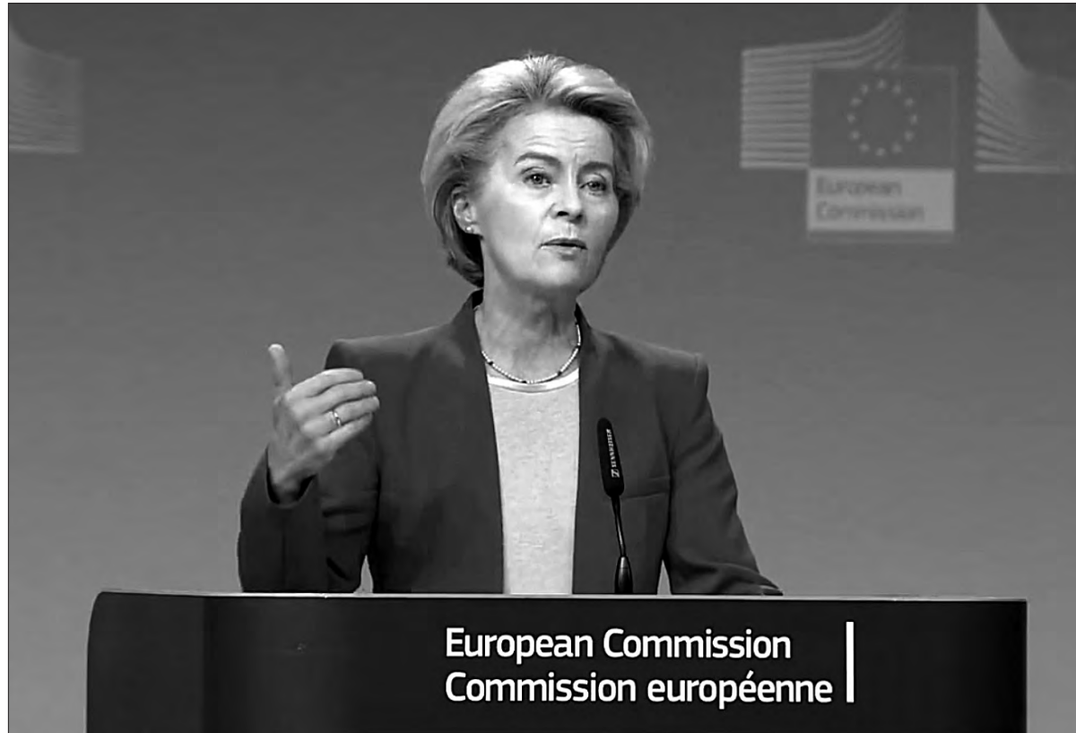
European Commission Commission européenne

Єврокомісія 8 листопада рекомендує відкрити переговори з Україною та Молдовою про вступ до Європейського Союзу. Про це повідомила Президентка Єврокомісії Урсула фон дер Ляен під час пресконференції з представлення у Брюсселі щорічної доповіді Єврокомісії щодо розширення ЄС. Вона зауважила, що Україна виконала понад 90 відсотків рекомендацій, висунутих Європейською комісією. «На цій підставі ми рекомендували сьогодні, щоб Рада відкрила переговори про вступ. Ми також рекомендуємо, щоб Рада схвалила переговорну рамку, коли Україна виконає реформи, які тривають», — сказала вона.