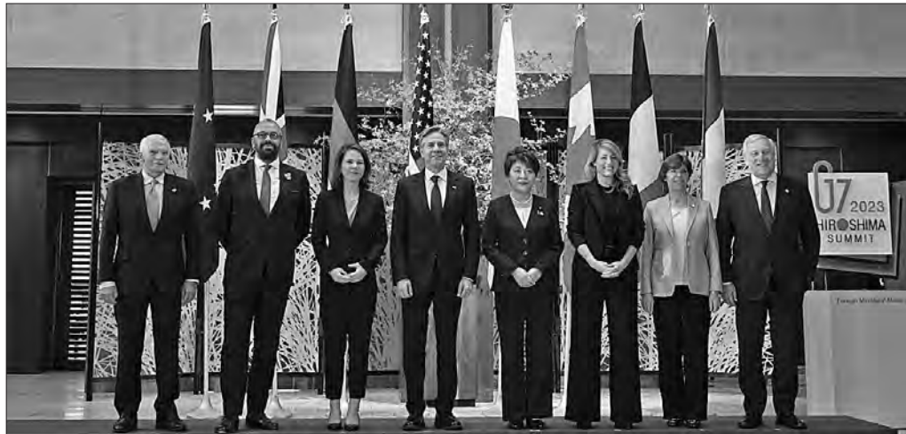
Глави МЗС країн «Групи семи» (G7) 7 листопада обговорили у Токіо ситуацію в Україні та скоординували її подальшу підтримку на тлі напруження на Близькому Сході. Сесія, присвячена Україні, тривала 80 хвилин.

На ній був присутній верховний представник Євросоюзу із зовнішньої та безпекової політики Жозеп Боррель.