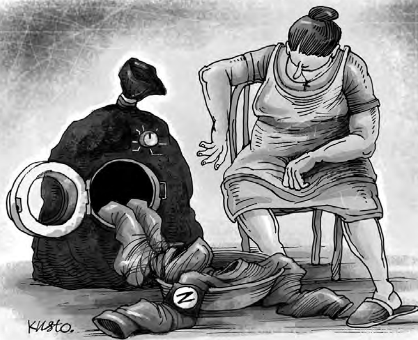
Пральна машина «Z».